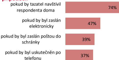
Graf 2: Vyplnění dotazníků ve vybraných případech

Obyvatelé ČR by byli v největší míře ochotni vyplnit předložený dotazník, pokud by byl výzkum prováděn formou osobního kontaktu tazatele s respondentem (F2F interview) , nejnižší míru participace je pak nutné očekávat v případě dotazování prostřednictvím telefonu.